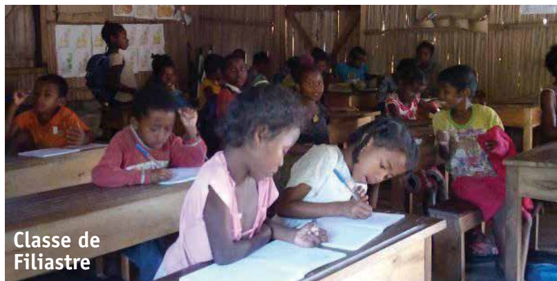
Classe de Filiastre