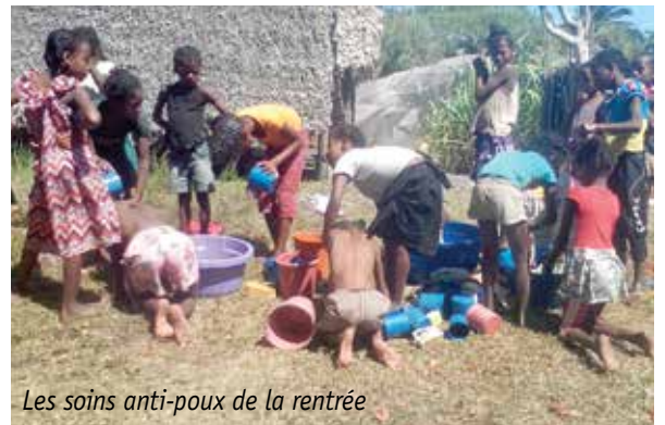
Les soins anti-poux de la rentrée