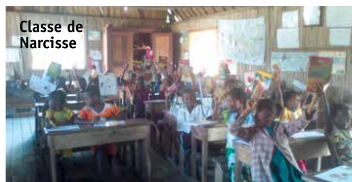
Classe de Narcisse