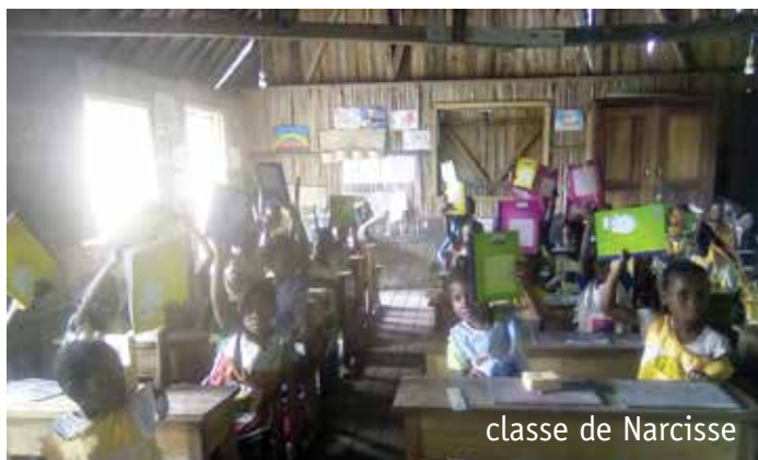
classe de Narcisse